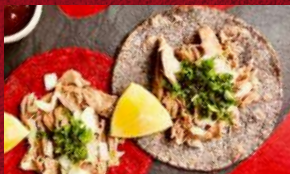
Orden de 2 Tacos