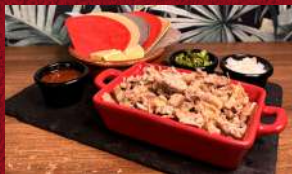
Cazuelita con 6 tortillas